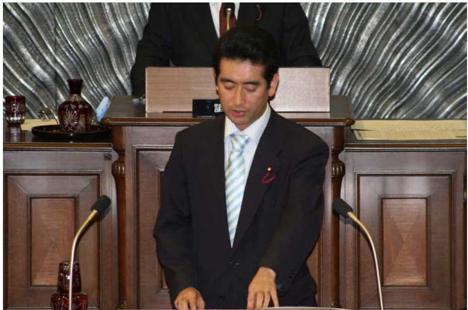
本会議場にて一般質問（2006年6月）

行政手続法46条には、自治体は「処分、行政指導並びに命令等を定める行為に関する手続について」「行政運営における公正の確保と透明性の向上を図るため必要な措置を講ずるよう努めなければならない」と規定されています。現在、普通地方公共団体の99パーセント以上が、また我が区を含む特別区の全てが、行政手続法上の適用除外とされた処分、行政指導、届出について、それぞれ努力義務を履行しています。しかし、昨年の同法改正により今後は、命令等、すなわち規則、審査基準、処分基準、行政指導指針等の制定手続にあたっては、また、恐らくは後述するように住民の権利義務に係る条例案や計画案についても、「公正の確保と透明性の向上を図るため必要な措置を講ずる」ことが期待されているのです。